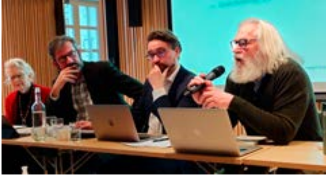
Ekspertgruppen legger frem sin rapport på sektormøtet 2. september