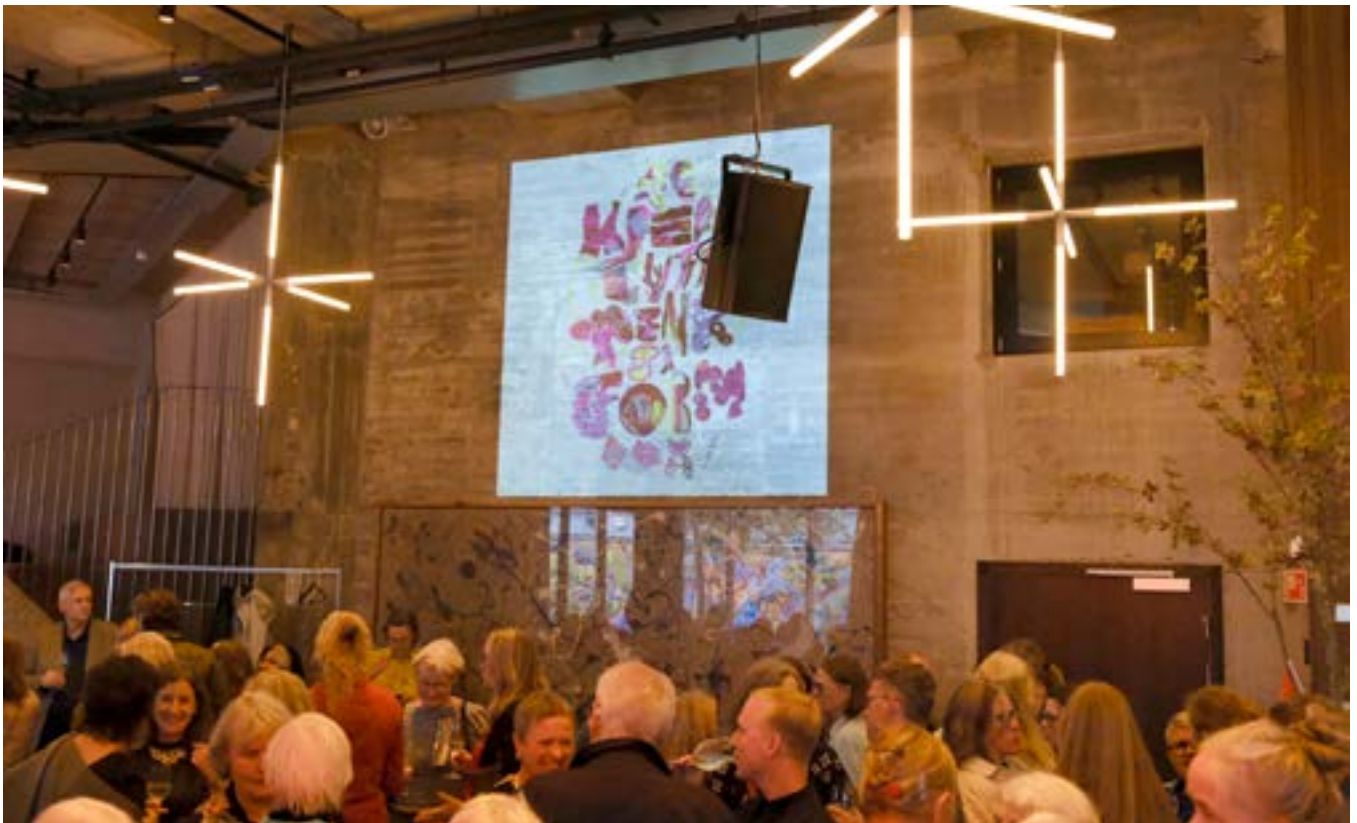
Fra jubileumsfesten på Trekanten i Oslo