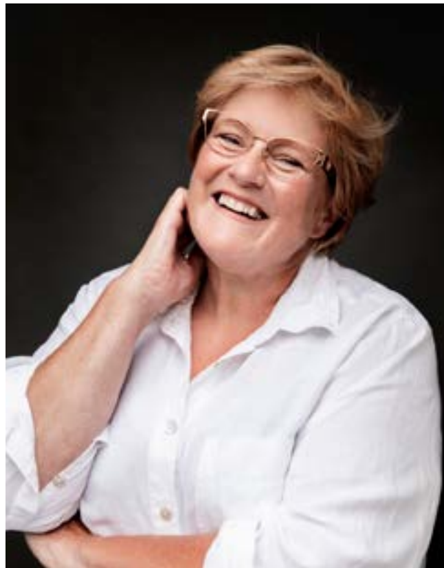
Trine Skei Grande

Her kunne det vært naturlig å fremheve at Norge ble valgt som gjesteland på den store publikumsmessen for litteratur i Leipzig. Der deltok både kronprinsessen og kulturministeren, sammen med en rekke forlag og 50 norske forfattere, blant dem Maja Lunde, Trude Teige og Karl Ove Knausgård.